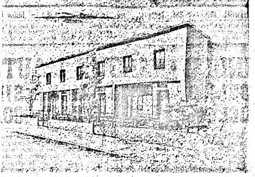
Prospettiva delle abitazioni di Tipo 7 affidate per la costruzione della Cooperativa Edilizia «Valdagno» alla Coop. di Produzione e Lavoro «La Pausellana» di Schio. Architetti: G. G. G. G.