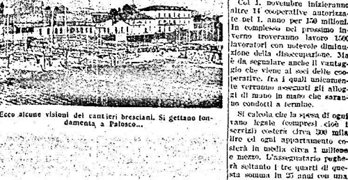
Ecco alcuni visoni dei cantieri bresciani. Si gettano fondamenta a Palosco.

8. Il presente articolo è applicabile alle cooperative che, al 31 dicembre 1948, erano iscritte nel Registro delle cooperative. 9. In caso di approvazione del progetto e del computo metrico, la Gestione Informativa deve essere costituita entro 30 giorni dalla data di approvazione del progetto.