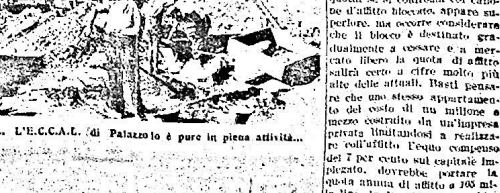
L'E.C.C.A. di Palazzo è pure in piena attività.

Il presente articolo è applicabile alle cooperative che, al 31 dicembre 1948, erano iscritte nel Registro delle cooperative. In caso di approvazione del progetto e del computo metrico, la Gestione Informativa deve essere costituita entro 30 giorni dalla data di approvazione del progetto.