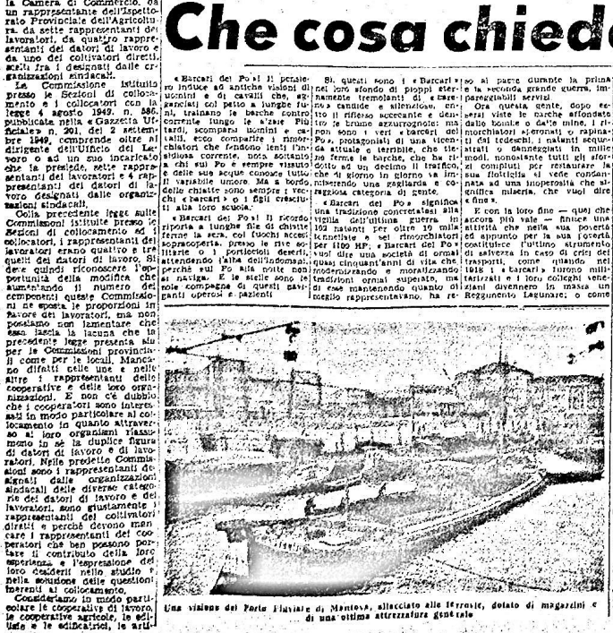
Una veduta del Porto di Livorno di Livorno, affacciato alle frotte, dotato di magazzini e di una ottima attrezzatura generale.

Una notevole importanza ha il problema della classificazione delle acque interne. La classificazione delle acque interne è un mezzo concreto per risolvere i problemi di sussistenza che si presentano in questi giorni.