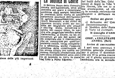
La maestranza della cooperativa col direttore dell'Unione