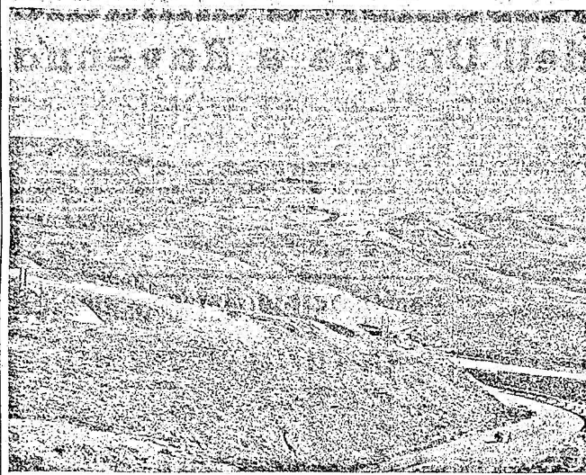
Ecco una suggestiva e impressionante visione di quel comprensorio agrario...