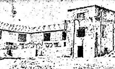
Miliducenzo case dovrebbero sorgere nella Sila entro il 1951. Ecco uno dei primi cantieri