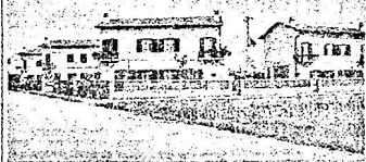
Questa villetta sono state costruite dalla Soresinese nel 1929...