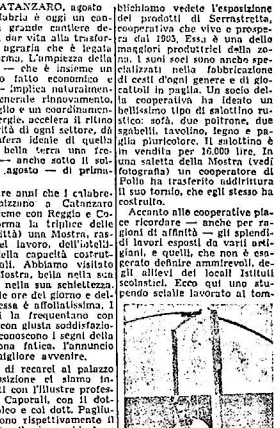
Una stupenda scialle, lavorazione a tombolo, specialità di Tirlo.

La Calabria è oggi un cantiere, una grande cantiere destinato a dar vita alla trasformazione agraria che è l'elemento della Riforma. L'impetuosa della Riforma — che è insieme un'opera di ricostruzione sociale — implica necessariamente un generale rinnovamento, un rivolo e un coordinamento di energie, accelera il ritmo dell'attività di ogni settore, dà un'impetuosa spinta alla vita e bella terra una fecondità e anche sotto il punto di vista di agosto un'impetuosa.