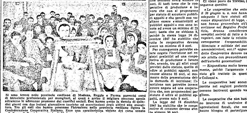
Il gruppo dei soci della Cooperativa Caseificio San Clemente in Valdagno.