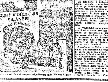
L'ingresso della Colonia creata tre anni fa dai cooperatori milanesi sulla Riviera Ligure.