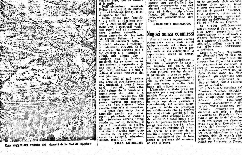
Una suggestiva veduta dei vigneti della Val di Cembra