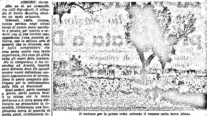
Il trattore per la prima volta affonda il vomere nella terra silana.

Essi sanno che l'assegnazione della terra non è che un primo passo. Con la formula cooperativa si ripromettono di risolvere molti grossi problemi quali gli acquisti collettivi, la selezione della razza, ecc.