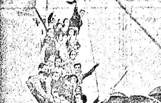
Il cooperatore abruzzese della S.C.L.A.P.I.B. salutato da bordo del "Biancamano" il suo della patria all'infine del loro viaggio migratorio per il Brasile