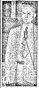
Ha visitato in questi giorni la Confederazione Cooperativa Italiana, incontrandosi con i suoi dirigenti...