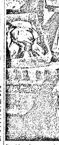
Esposizione di pesce per la vendita al Centro di raccolta di Porto Levante della Cooperativa Pescatori di Scardovari.