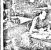
Una visione dei Servizi di contabilità, nel pagamento del premio, fiammante presso una Compagnia di Assicurazione della Nuova Zelanda.

Il principio cooperativistico ha avuto una parte importantissima, e sotto molti aspetti caratteristici, nel popolamento, nella colonizzazione, nella struttura economica stessa della Nuova Zelanda; e contempo ad avere, non meno esteso ed interessante, un ruolo attuale di quel lontano e progressismo Dominione ecclesiastico Compendio di questo paese è stato definito il più socialista del mondo; e ciò è stato attribuito, cronologicamente al fatto che dal 1935 al 1949, senza soluzione di continuità, ha potuto essere governato da un governo laburista rigido e dinamico. In verità tutte le premesse della legislazione sociale variano dal laburista, durante i quindici anni della loro gestione erano poste in un'epoca precedente ed erano esse, a dirsi, nel modo medesimo come è avvenuta la colonizzazione britannica di questo paese, e favorite dal clima, dalla ricchezza dello suolo e dalla spaziosità del paesaggio tanto simile a quello italiano.